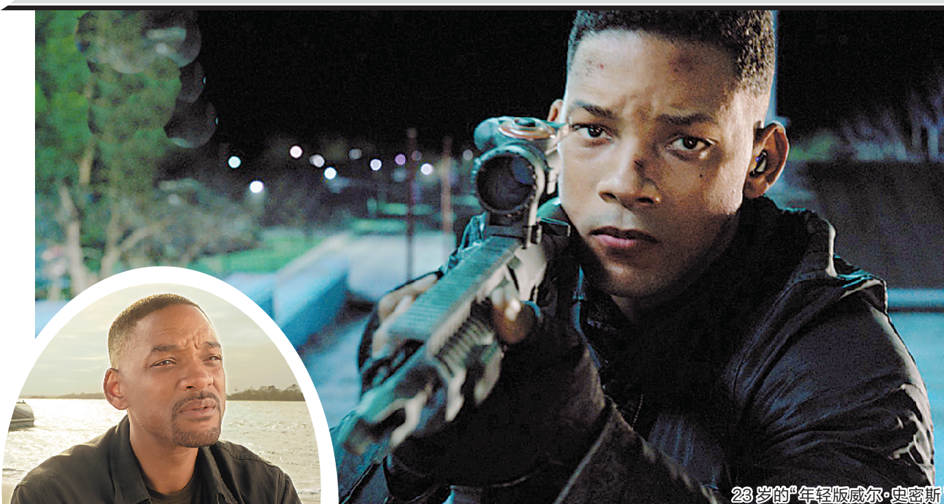
51岁的特工亨利(威尔·史密斯饰)