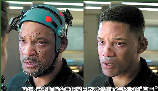
威尔·史密斯被全身扫描3次才造出了年轻版的“自己”

上周末,中国内地影市迎来两部最新大片——李安执导的《双子杀手》和安吉丽娜·朱莉主演的《沉睡魔咒2》。《双子杀手》被寄予厚望,但首周末三天总票房却略逊于《沉睡魔咒2》。 “失望”“感觉一般”“没看出什么惊喜”……对于以“3D/4K/120帧”技术拍摄的《双子杀手》,很多观众却给出了“不过尔尔”的结论。难道所谓的“电影技术革命”只是一个噱头?羊城晚报记者在了解后发现,观众对《双子杀手》的技术革新,譬如“3D/4K/120帧”以及“造人术”并未有足够的了解,甚至并未选择能展现这种最高拍摄格式的影厅去观看,这导致了观看效果大打折扣。