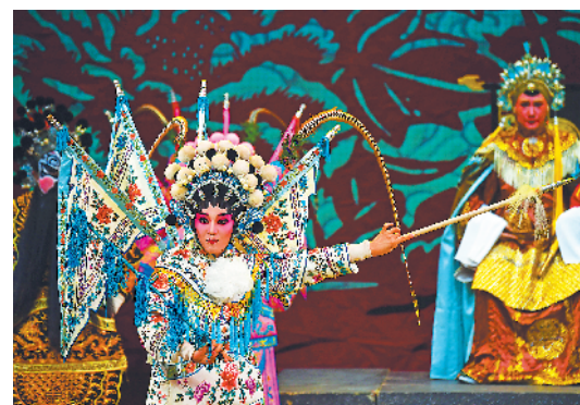
传统经典老戏让观众大饱眼福

羊城晚报讯 记者黄宙辉,通讯员刘井亮、杨宇报道:10月22日晚,“岭南风华——广东省庆祝中华人民共和国成立70周年戏剧惠民演出”暨启动仪式在广东省粤剧院艺术中心举办。本次惠民演出将在全省一共举办41场,全部免费请观众睇戏。22日晚,数百名观众率先在现场观看了第一场演出。 22日晚的首场演出共有11个节目,涵盖了粤剧、潮剧、广东汉剧、雷剧、西秦戏、白字戏、正字戏和五华采茶戏等八个剧种。演出剧目均为各剧种中的代表性剧目,或为脍炙人口的传统经典老戏,或为反映中国共产党光辉奋斗历程的现代剧目。