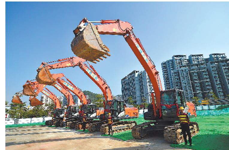
13个公共住房项目集中开工

根据深圳市公共住房相关建设计划,明年开始,深圳市将有大批人才住房、安居型商品房面向符合条件的人才、市民供应。值得关注的是,这些公共住房的售价均为周边地区市场房价的5-6成。位于原特区内的限价人才住房项目毛还房售价处于4万-5万元/平方米区间,最高售价原则上不超过5万元/平方米;位于原特区外的限价人才住房项目毛还房,普遍处于2万-3万元/平方米区间,最高售价原则上不超过4万元/平方米。