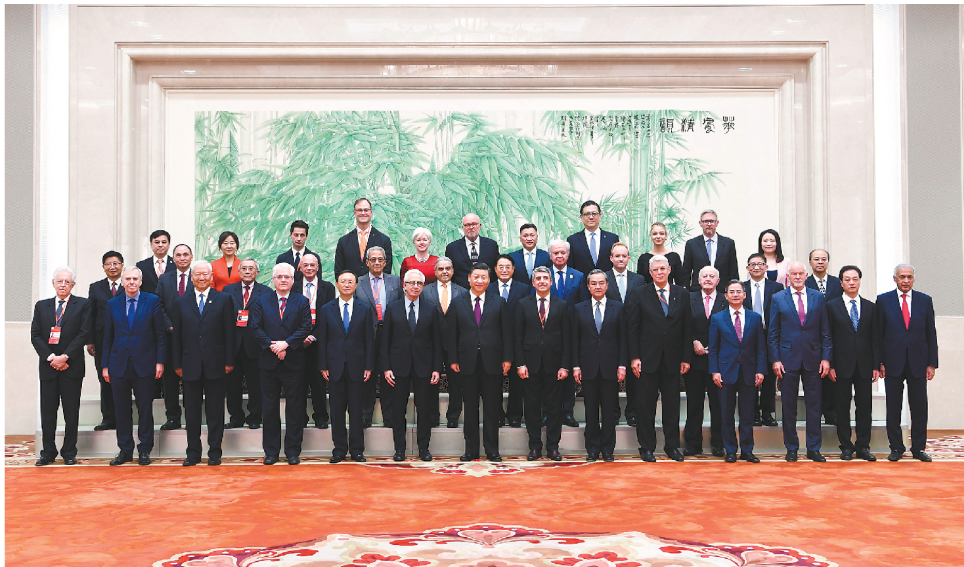
25日，国家主席习近平会见出席2019年“读懂中国”国际会议的外方嘉宾代表

据新华社电 国家主席习近平25日在人民大会堂会见出席2019年“读懂中国”国际会议的外方嘉宾代表，同他们集体合影。习近平希望他们加强同中国的交流，真正“读懂中国”，切实增进中外相互了解和认知。杨洁篪、王毅等参加上述活