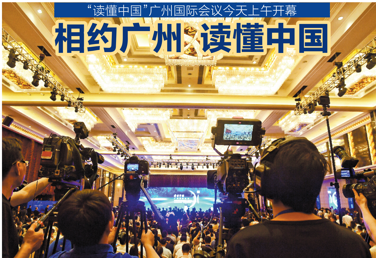
2019年“读懂中国”广州国际会议于10月26日在广州开幕

羊城晚报讯 记者罗仕、梁栩豪报道：相约广州，读懂中国！今天上午，“读懂中国”国际会议在广州香格里拉酒店开幕，来自全球的数百位政治家、战略家、理论家和企业人士相聚羊城，围绕“新一轮经济全球化和中国改革开放再出发”这一主题展开深入研讨。