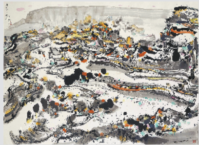
吴冠中, 《美利坚大峡谷》, 123.3x170cm 佳士得2019年秋季拍卖会

近年来, 吴冠中的作品受到不同背景的藏家的热烈追捧。今年适逢吴冠中诞辰一百周年, 佳士得从全球各地荟集到多件吴冠中重要作品, 在秋季拍卖中呈现一个重要的专题拍卖, 其中最重要的两幅作品即是北美私人收藏的《尖沙咀》和《美利坚大峡谷》。