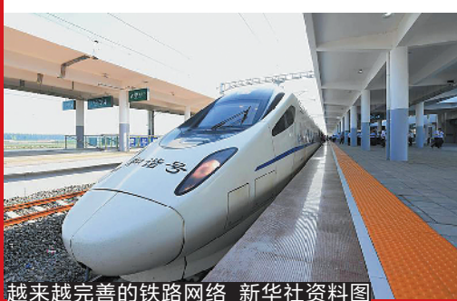
越来越完善的铁路网络

以往市民专程去增城新塘玩的不多,其实新塘也有不错的游玩去处,其中当地的瓜岭村,是“中国传统村落”、“广州市美丽乡村”,典型的岭南水乡风格,水道、荔枝林、祠堂、民居分布有序,形成一个独特的布局。当年旅居国外的华侨集资在村里建起了两座碉楼——棠荫楼和宁远楼,中西结合、造型奇特,颇有观赏价值。而在地铁沙村站附近有新塘海鲜城,海鲜价格亲民。