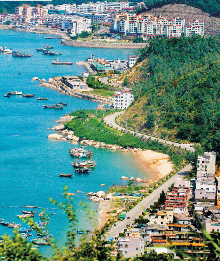
南澳月亮湾 张健伟 摄(资料图)