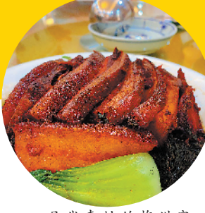
具代表性的梅州客家菜——梅菜扣肉

梅汕高铁在本月正式开通,由广州东站或南站出发,不到4小时即可直达梅州西站,下车直接游玩。这让汇集了自然生态、红色与客家民俗、客家建筑、客家美食、康养长寿等众多旅游元素的梅州,真正变成了广州市民休闲旅游的新“后花园”。