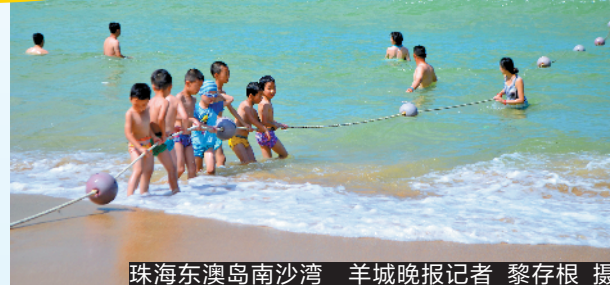
珠海东澳岛南沙湾

随着季节变化,广东也逐渐有了秋天的气息,白天不再暴晒,晚上凉风习习。而已经进入了尾声广东滨海玩水季,此时海滩上没有了汹涌的人潮,蓝天白云、和风送吹拂下更多了一丝自在,倒是滨海游的好时机。省内滨海热门地中的珠海、汕头、湛江三地中,分别有一条滨海线路入选十条首批广东最美旅游公路中,美景公路名副其实,最适合自驾游。