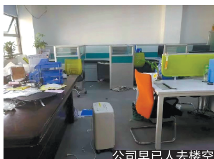
公司早已人去楼空

民警介绍，这种“两头骗”的主要套路分为几个步骤。首先，发布包装贷款广告，通过拨打电话、发送短信，或者在微信群、QQ群发布“贷款中介”广告，吸引急需资金而又符合银行贷款条件的客户。其次，引导客户办理新的电话卡、银行卡，然后以“方便做银行流水、应对银行回访、缴纳社保和公积金”