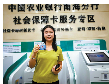
参保人通过自助设备快速办理社保卡

“农业银行南海分行5分钟内实现社保卡即时新卡并在自助机上进行自助激活，此种自助式的社保卡发卡服务模式在广东省内领先。同时，农业银行南海分行、建设银行佛山分行、工商银行佛山分行、顺德农