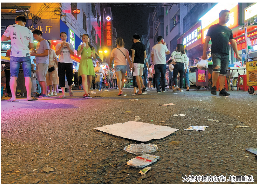
大塘村桥南新街，地面脏乱

羊城晚报在国庆期间曾对广州部分夜经济旺地市容环境保洁不力进行曝光(详见10月4日A3版报道)。被曝光的地区，迅速整改(详见10月14日A6版报道)。连日来，记者继续走访发现，城中还有不少夜间市容环境待改善地区，希望通过精细化的城市管理，让夜经济旺地既兴旺又干净。