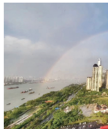
琶洲旧改,是城市更新一次很成功的样本

而这恰恰是保利的机会。保利是广州第一个主导城中村改造的企业。作为“城市更新专家”,保利曾经创造多项纪录,比如我们熟悉的保利琶洲城市更新项目,其旧改规模大,满意度高,旧改