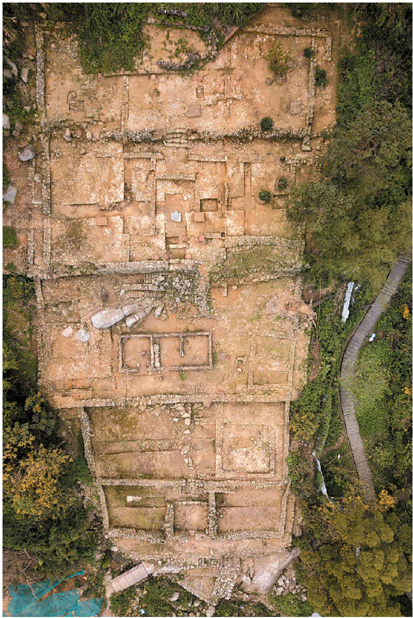
莲花书院遗址俯视图,可分明地看到五层平台结构

从祀孔庙是古代社会朝廷正统对于真儒的至高肯定,意味着对其学术成就、儒家修养以及个人道德的全面弘扬。自古以来,岭南得以从祀孔庙的只有明代陈献章一人。 陈献章(1428—1500),明代著名思想家、教育家和诗人。他因长居广东江门白沙村读书、讲学,史称白沙先生或陈白沙。陈献章少时曾师从江西理学家吴与弼,后因“未知入处”而返乡。他在家乡筑春阳阁闭门读书,静坐十年,终于悟出“静养端倪”“自得之学”,完成“作圣之功”,开创白沙心学,打破了程朱理学的独尊地位。自此明代学术“始入精微”(黄宗羲语),并传递出思想解放的清新风气。 1483年,明宪宗下诏请他入京,途经广州时,白沙先生乘坐官府依照古礼所配备的“公车”,从城北往城南游行,引得成千上万羊城百姓围观,盛况无两。 从38岁开始,白沙先生在家乡设馆讲学。他强调“为道当求诸心”,领着前来追随读书的弟子们优游山水、吟风弄月,追求“鸢飞鱼跃”的诗教悟道之境,以“学贵自得”“学贵知疑”为核心,开创了岭南第一个成熟的学术派别“江门学派”。后来,随着弟子湛若水、张诩、梁储、林光等人仕途精进,同时持续讲学、广办书院,白沙心学的影响进一步扩大,不仅深深浸润了直至清代岭南士子的学术风尚和行方式,而且促使“岭学”首次登上中国儒家文化舞台的中心。1584年,陈献章与王阳明一同入祀孔庙。在此前后,出现了岭南书院教化大兴、粤籍士大夫群体形成、地域儒学先声进入主流正统一系列新气象,广东已不再是野蛮荒之地的代名词。