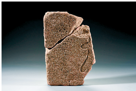
“乙巳春泉翁书(卷)”残碑

湛若水虽遵循的是传统士子读书、仕进、为官、授业的轨迹,但他的心学修为、高寿以及对书院教育的极端热衷,又带来了许多传奇性。 29岁时,湛若水成为岭南心学开创者陈献章的门生,从此“宗自然”、讲“静坐”,三年后悟出了“随处体认天理”,深得老师嘉许,终以学术衣钵——江门钓台见赠,被认定为白沙心学的正宗传人。39岁时,他才北上继续科考,中了进士,结果一路为官,历任南京吏、礼、兵三部尚书,一直到75岁才得致仕(退休)。 哪怕在今天,年逾古稀都应是休养生息之时了,四百多年前的湛若水却迎来了他一生中最纯粹、最繁忙的办学和讲学时期。他在广州、惠州、佛山、南京等地新建的书院就有十五六家。湛若水有一首《四居吟》“罗浮春花发,西樵夏木蕃。天关秋水清,甘泉冬背寒”,描述自己晚年春居罗浮山朱明