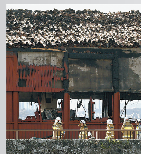
首里城火灾现场一角