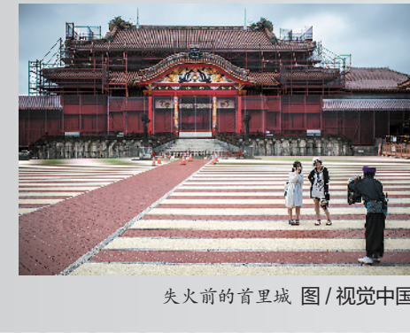
失火前的首里城

智利总统皮涅拉10月30日宣布，智利政府放弃主办原定分别于今年11月和12月举行的亚太经合组织（APEC）领导人非正式会议和联合国气候变化大会，优先应对国内局势。（新华社）