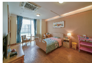
保利广州中和嘉会

本次评选活动颁奖典礼，将于2019年11月2日上午在保利世贸博览馆举办的“第六届中国国际老龄产业博览会”上举行。更多本次活动介绍，请扫描“羊城晚报老友记”公众号二维码