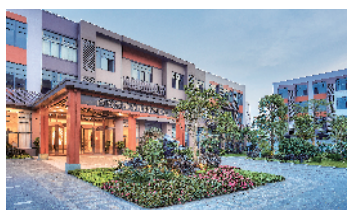
广东百悦百泰(番禺)城市颐养中心

现在老人对养老的观念发生了巨大的变化，“养儿防老”观念已经成为过去式，许多老人不再依赖子女养老，更愿意规划自己的晚年生活。有的想和朋友、同学“抱团养老”；有的想冬天住在南方、夏天住北方的“候鸟式养老”，有的想离家不离亲，在“家旁边养老”……于是，近年来各种新型的养老机构、养老服务产品应运而生、层出不穷，比如嵌入式养老机构、养老公