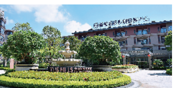
招商高利泽·广州番禺国际康

本次评选面向养老机构、养老社区、养老院进行评选，分别从环境设施、医疗护理、膳食营养、文化生活等多维度对养老机构进行评审。根据养老机构性质、服务定位，本次评选设定最佳养老品