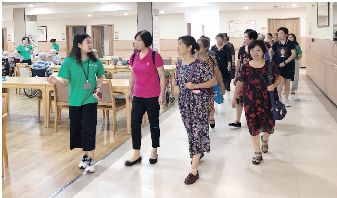
评审团在越秀银幸颐园(赤岗)养护院参观