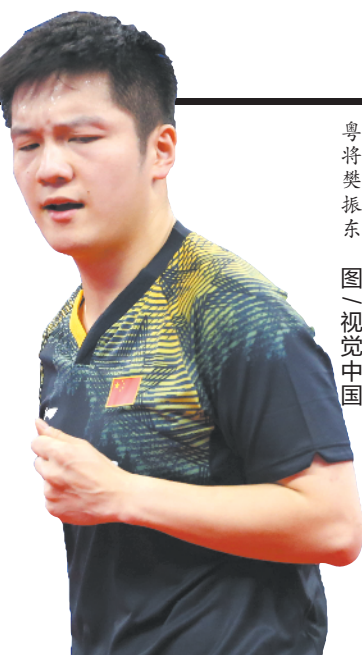
粤将樊振东

为更好地备战此次比赛，国乒日前已提前前往日本，适应比赛环境。昨天，国乒部分教练员、运动员在训练之余来到日本东村山市，与当地热爱乒乓球的民众进行交流互动，受到热烈欢迎。