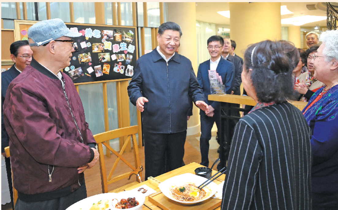
2日下午，习近平在长宁区虹桥街道古北市民中心老年助餐点，同正在用餐的居民热情交谈

临近傍晚，习近平来到长宁区虹桥街道古北市民中心考察调研。古北社区居民来自50多个国家和地区的居民。习近平听取社区开通社情民意直通车、服务基层群众参与立法工作等情况介绍，并同正在参加立法意见征询的社区居民代表亲切交流。他强调，你们这里是全国人大常委会建立的基层立法联系点，你们立