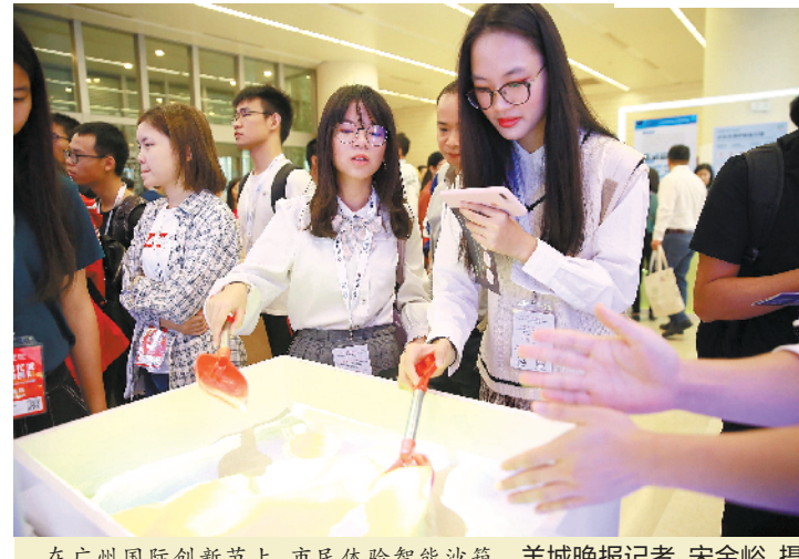
在广州国际创新节上,市民体验智能沙箱

“楼道撤桶,更需要精细化的管理。”富力银禧花园物管项目负责人介绍,为破解不少楼道撤桶小区定点投放时段以外居民仍将垃圾投放到定点投放点导致一楼垃圾堆积的问题,物管目前已加强巡查,要求全体物管人员看到垃圾堆积即“随手捡”,并引导居民到误时投放点投放。