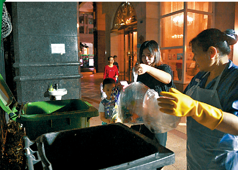
晚上,督导员(右一)指导富力银禧花园业主投放垃圾

记者从活动中获悉,在整区推行“楼道撤桶”两个多月后,海珠区厨余垃圾分类量明显增多,经判定分类合格的厨余垃圾量超过相关部门对该区的评估值。通过两个多月的实践,该区已逐渐探索出通过精细化管理在定时投放时段达到良好分类效果、非定时投放时段维持小区干净整洁的方法。