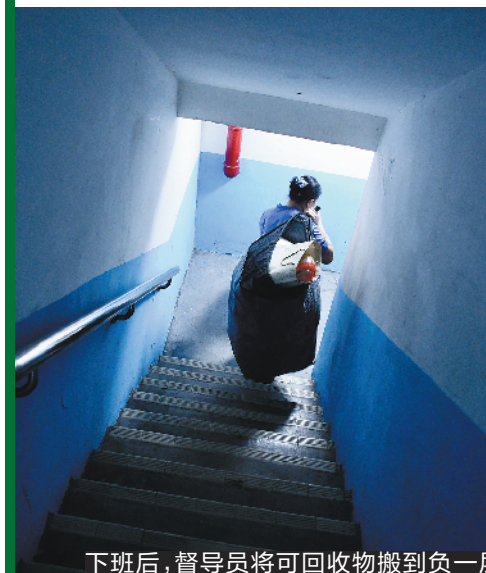
下班后,督导员将可回收物搬到负一层

“权威加趣味的宣传,有助居民参与垃圾分类。”富力银禧花园物管项目负责人告诉记者,政府部门深入社区宣传垃圾分类,对物管对居民的帮助都很大,如垃圾分类以及某一种垃圾属于什么垃圾等问题,居民和物管未必掌握权威答案。政府部门通过耐心讲解,将垃圾分类的权威信息告知居民,帮助他们认识到垃圾分类的重要性。