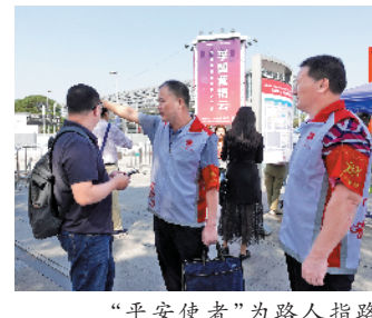
“平安使者”为路人指路

据了解,2018年7月,“海珠平安使者”微信小程序正式上线,截至目前,在上面登记的平安使者已经超过15万人。为了将平安促进会下沉到各街道,今年年初,全区18个街道完成各街道平安促进会(社会团体)的成立和登记注册工作,街道每个社区还建立了自己的“邻里共治”微信群。“现在街道平安促进会可通过社区群、楼宇公告栏等方式发布巡防任务,吸引热心公益的社区居民积极参与。”区委政法委相关负责人表示,目前,海珠区已建立一支覆盖全区范围的平安使者志愿队伍。