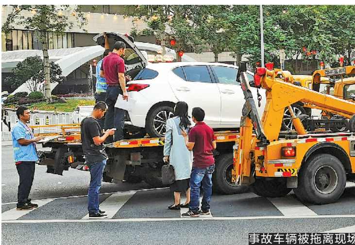
事故车辆被拖离现场