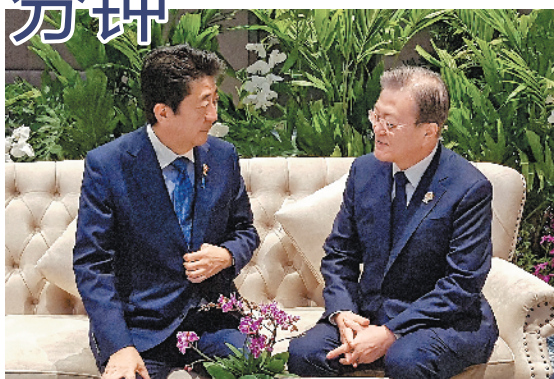
4日，文在寅(右)与安倍会面的情形