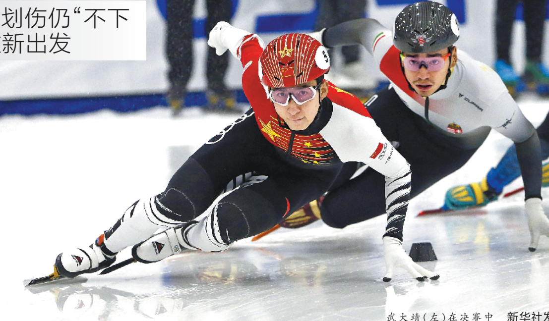
武大靖(左)在决赛中

武大靖是平昌奥运会短道速滑男子500米冠军,并在2018-2019赛季三次打破男子500米短道速滑世界纪录。此次盐湖城站,是武大靖首次在王濛带领下出征,后者新上任速度滑冰和短道速滑国家队教练组组长。虽然队长的由过去的恩师李琰换成了昔日队友王濛,但武大靖丝毫没有放松对自己的要求。此次中国短道队参加国际大赛的阵容是经过队内直通赛选拔出来的,武大靖在直通赛三个奥运单项的争夺中,先后夺得500米、1000米和男女混合2000米接力冠军,并在最终的全能积分榜上排名第二。王濛当时透露,武大靖此前因腿部被冰刀划伤做了一个小手术,原本队内给他开了绿灯,让他免赛资格赛直通决赛,但武大靖拒绝了队里的