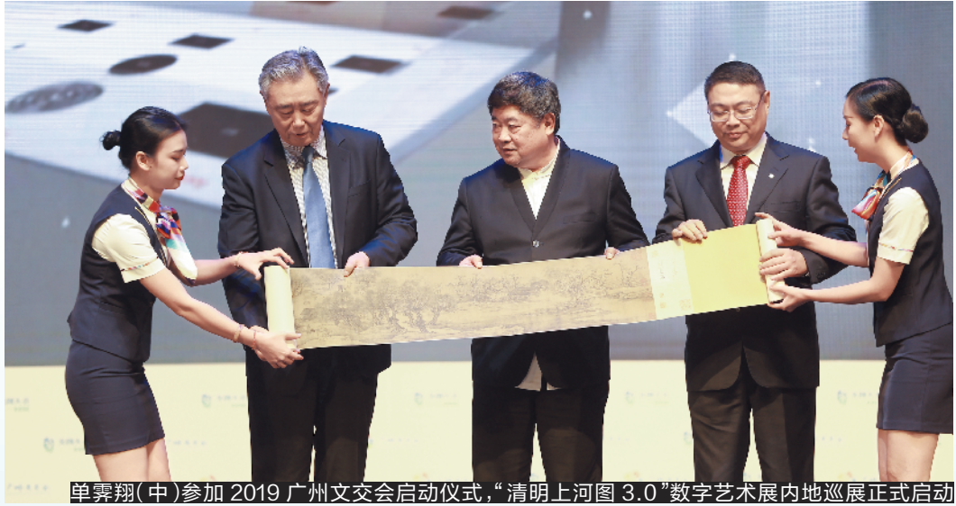
单霁翔(中)参加 2019 广州文交会启动仪式，“清明上河图 3.0”数字艺术展内地巡展正式启动

什么是好的博物馆？对这个问题，单霁翔有自己的看法：“包容更多的文化理念，举办更多丰富多彩的活动，让人们在休闲的时候愿意走进来，走进之后流连忘返，回家后还想再来的博物馆，这就是好的博物馆。”