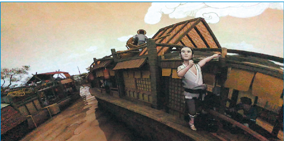
“汴河码头”球幕影院的 180° 影片采用一镜到底的技术，描绘汴河从白天到傍晚的生动景象，参观者置身其中，仿佛正行驶在《清明上河图》的汴河上

“所得的收入除了用于学术研究外，都用到了学校、社区的教育中，我们的教育活动免费面向孩子，把营销费用用在下一代身上是最值得的！”卸任故宫博物院院长一职之后，单霁翔被聘任为故宫学院院长。这是一所业务培训和教育机构，也是国内首家以博物馆办学模式成立的“学院”。