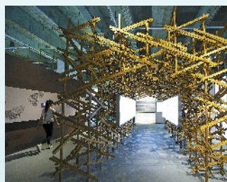
清明上河图主展区将带观众“重返”宋代

“20 位画师耗时两年，画了 146000 多张人物手绘图，才得以让原作人物动起来。”长卷主创、凤凰数字科技设计总