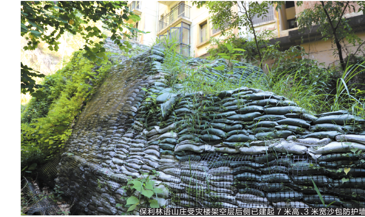
保利林语山庄受灾楼架空层后侧已建起7米高、3米宽沙包防护墙

羊城晚报讯 记者梁梓颖、通讯员范敏玲、钟飞兴摄影报道：去年6月8日，因台风“艾云尼”袭击，带来强对流天气，位于广州市黄埔区开创大道北的保利林语山庄林荟街6号、8号楼的后山突然滚落大石，砸坏小区一栋住宅楼。5日，记者从黄埔区获悉，该区在巨石滚落意外发生后一年多，持续对落石隐患和受损房屋进行治理，与落石相关的隐患目前已获得有效治理。 据了解，意外发生时，有3块巨型石块在强对流天气下从保利林语山庄小区后山滚落。其中最具破坏力的一块巨石达3米多高，自重70多吨。巨石滚落期间不仅破坏了林荟街6号楼的挡土墙和防护网，还把6号楼首层架空层承重墙撞垮。除这块最具破坏力的巨石外，另一块自重8吨多的巨石，亦对6号楼主体结构造成冲击破坏。所幸意外发生时6号楼架空层没有人员滞留，无人伤亡。 记者从黄埔区获悉，从事发当天起，政府有关部门立即开展小区后山应急排除，相关单位与业主展开了首轮灾后善后商讨。今年11月19日，黄埔区邀请股跃平教授等9名参加过汶川地震等重大事件处理的国家、省内顶尖地质灾害防治专家，先后开展了两场专家咨询论证会，对地质灾害勘查报告和治理方案反复论证，完善永久治理设计方案，严格把控设计、施工、监理各环节的质量，消除即时隐患。上述方案设计了三重治理防护网：对于浅层滑坡，清除滑坡体，并分级修坡，安装抗滑桩和预应力锚索；对于孤石、危岩体进行清理，同时加封SNS柔性防护网，并注浆、锚杆（索）结构加固；对于岩质边坡，清除表面杂物，加封SNS柔性主动防护网以及随机锚杆。 目前，地质灾害治理和受损房屋修复正在实施中，一排7米高、宽约3米的沙包防护墙，堆放在受灾架空层后侧，后山坡面也已安装了防护网。黄埔区通报称，在林语山庄地质灾害善后矛盾化解过程中，该区先后投入人力600多人，组织各种协调会、沟通会50余场，帮助受灾居民解决了30多起合理诉求和实际困难。