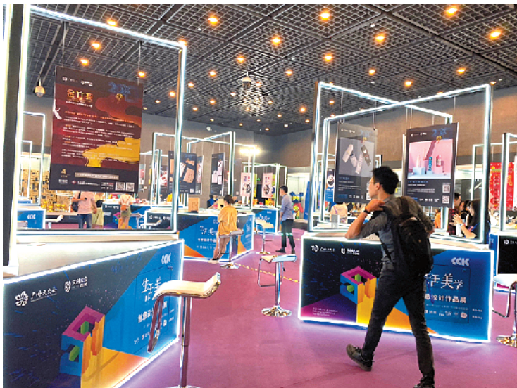
生活美学创意设计作品展现现场

本次广州文交会将国际化超级文化 IP 肖邦音乐节引入广州,推动肖邦艺术在中国的延伸与发展,让更多孩子近距离享受国际艺术资源,就是助力广州文化综合实力出新出彩的体现。5 日晚的音乐会由第 14 届肖邦国际钢琴比赛冠军、国际著名钢琴家李云迪先生领衔,众多东西方著名音乐家及机构加盟,为广州观众呈现了一场高规格的国际化音乐盛会。