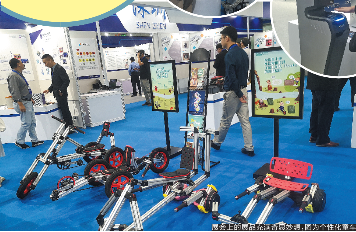
展会上的展品充满奇思妙想,图为个性化童车

值得一提的是,本届发明展特别设立了粤港澳大湾区展区,展区组织了澳门紧电科有限公司、广州麦仓信息科技有限公司、深圳市万物互联科技发展有限公司等182家企业的291个项目,按城市分别参展,展馆总面积达到5000平方米。