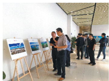
阳江市交通运输局相关工作人员参观摄影展

据了解,“龙腾港珠澳”摄影作品巡展启动以来,已在广东多个地市展出,好评如潮。记者从现场获悉,本次展览分为大桥开通、大桥美景、建设历程及建设者三个部分,共100多幅作品,不仅折射出国家发展和粤港澳大湾区建设的澎湃脉动,更展示了大桥建设者的美丽风采和精益求精的工匠精神。“今天起,阳江的市民群众也有幸一睹这些精品影像,我相信,对每一位参观者来说,这都是一个生动的主题教育课,是一次深刻的精神洗礼,大家都能从中获得激励、受到鼓舞。”阳江市交通运输局相关负责人说。