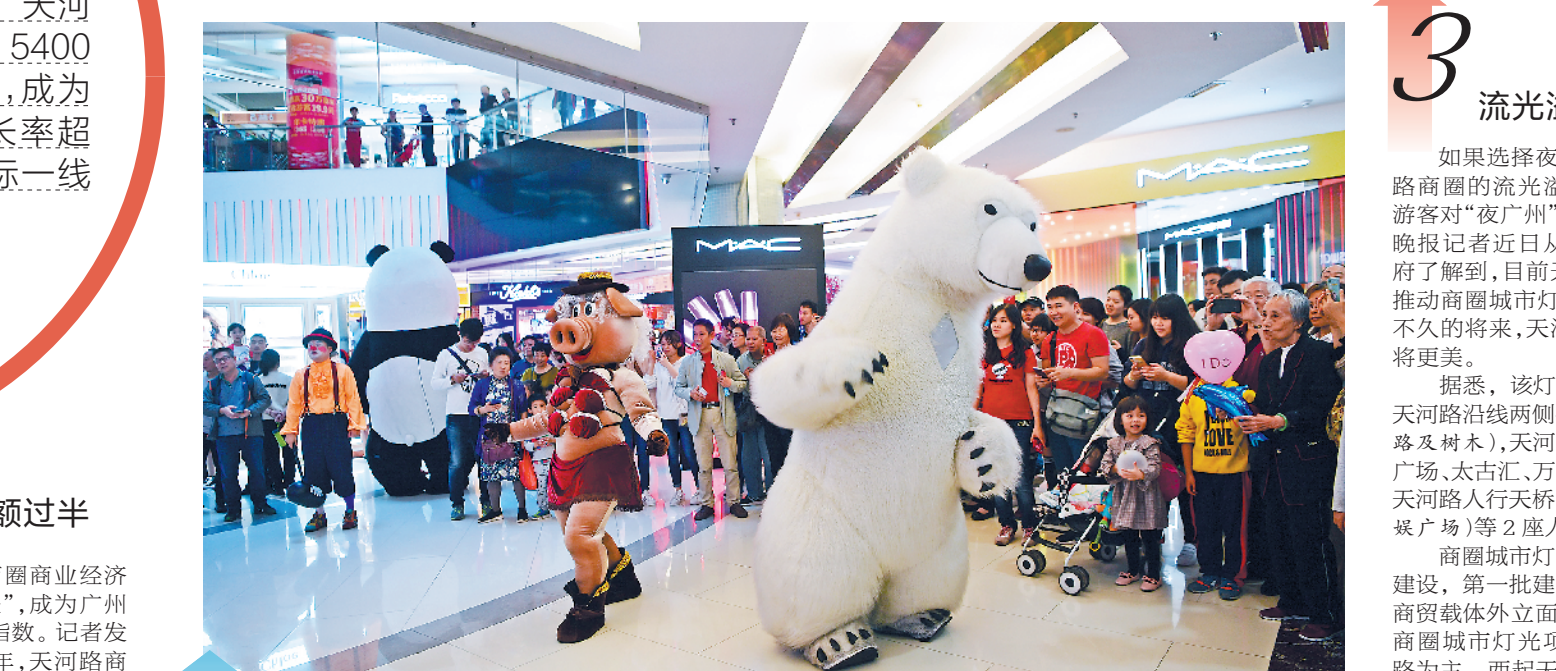
天河路商圈善于用特色活动促销打造浓郁的购物氛围

1 面积不到全区1/20 商品销售总额过半 从“千年商都”向“现代商都”跃升，广州在推进打造世界旅游名城和旅游目的地过程中，天河路商圈是广州商旅文深度融合的重要抓手和成功典范。从2012年起，连续8届，由政府、商会、企业联手打造的广州国际购物节，成为天河路商圈一个独特的品牌。每年购物节期间，天河城、正佳广场、太古汇、天环广场、万菱汇、维多利、广州购书中心等载体，利用户内中庭及户外广场，结合店庆、品牌展示、时装展等活动设置特色造景，在天河路上打造出浓郁的购物节活动氛围。在主题为“千年商都购物天堂”的2019年广州国际购物节上，很多国内外游客亲眼目睹了天河路商圈的风采。据统计，主会场天河路商圈人流同比增长超过20%，各大载体营业额实现两位数增长。2014年广州国际购物节期间，天河路商圈推出全国首个商圈商业指数——天河路商圈商