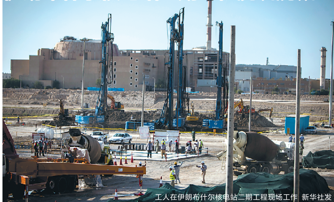
工人在伊朗布什尔核电站二期工程现场工作

当地时间10日下午,伊朗布什尔核电站二期工程举行混凝土浇筑仪式。伊朗原子能组织主席萨利希和俄罗斯合作方代表出席仪式。