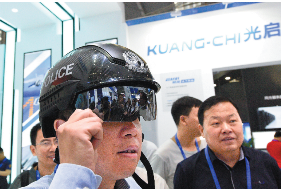
高交会上展出警用防弹智能头盔，安全性比传统头盔提高一个等级，重量比传统头盔减轻三分之二，仅重1080克，同时具备实时人脸识别等智能警用功能

利、巴林、日本、韩国、美国、欧盟等44个参展国家和地区中，有37个国家来自“一带一路”沿线。 此外，本届高交会还设置了粤港澳大湾区展区，并首次设置了科普展分会场。 本届高交会中国高新技术论坛还设有“新时代、新技术、新经济”主题论坛、“改变世界的新兴科技”主题论坛、“创新引领未来”主题论坛、“活力湾区与科技创新”主题论坛等。国家相关部门也将举办高层次论坛，商务部将举办“中国无人系统与未来高峰论坛”“无人系统安全性与可靠性技术论坛”，农业农村部将举办“农产品质量安全与标准发展论坛”，国家知识产权局将举办“知识产权与高质量发展论坛”，中国科学院将举办“信息与生物技术院士论坛”，中国工程院将举办“2019年战略性新兴产业培育与发展论坛”。 据悉，诺贝尔奖得主、图灵奖得主、中外院士、科学家、经济学家等重量级嘉宾将在本届高交会中国高新技术论坛上发表演讲。IBM、博世、飞利浦、富士通、美的、迅雷等中外领军企业高层、伊期、匈牙利、塞尔维亚、爱尔兰、阿联酋等5个国家的副部长及以上政府高级官员也将出席本届高交会。