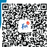
扫一扫看诗情画意西溪南

业态丰富了,创意提升了,西溪南愈发成为传承徽州文化的“老堂前”,迎接海内外宾朋的“新客厅”。