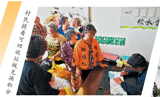
村民提着可回收垃圾兑换积分

实施乡村振兴战略、推行“河长制”“林长制”、开设“生态美超市”、打造“十里江湾”……近年来,安徽加快推进产业转型升级,大力调整结构、优布局、强产业,走出了一条高质量发展新路,更让绿色发展成果不断惠及民生。