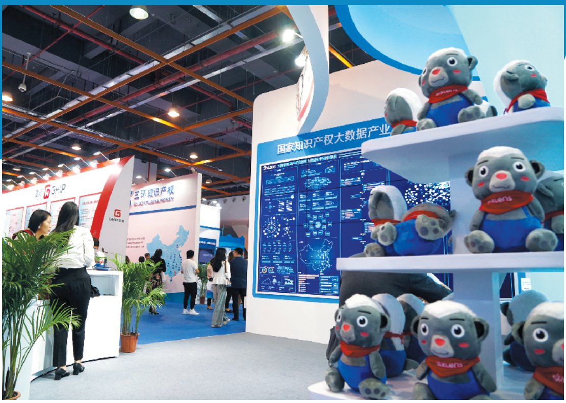
本届知交会参观人数创新高

志产品展会上,笔者看到,来自全国12个省份的26个地理标志参展机构携数百种地理标志产品汇聚于此。地理标志的参展,不但给参展机构带来了展示机会和成交商机,也让参观者大开眼界。