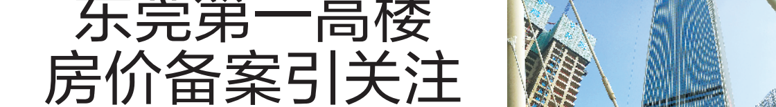
建设中的东莞国贸中心项目