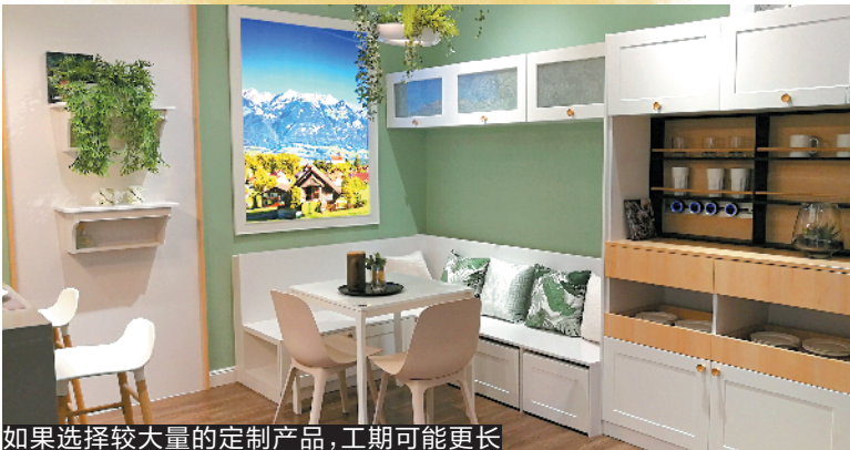
如果选择较大的定制产品,工期可能更长

“双十一”已过,装修的冲刺期又将到来。与去年不同的是,今年春节来得早,现在还有大约两个月时间,羊城晚报记者从多家家装公司了解到的情况表明,如果你想要在2020庚子鼠年春节前完工,11月中就已是最后的开工时间了。