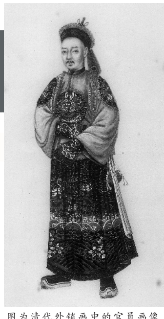
图为清代外销画中的官员画像

多年以来,中西贸易主要集中在粤海关,逐渐形成了广东督抚、粤海关监督以及内务府官员三位一体的利益集团,他们从陋规中分润,赚得盆满钵满。沿海各省虽也有陋规,但比起粤海关还是小巫见大巫。当然,这些既得利益是建立在商埠垄断的基础上的。一旦有了竞争者,资源分配就会重置。舟山就是潜在的变量。 舟山的热闹,对广东的最大冲击,就是来广州做生意的英国商船逐年减少。乾隆十九年至二十二年(1754-1757年)依次为27艘、22艘、15艘、7艘。粤海关的税银盈余也相应递减。因此,当英国船只动身前往宁波时,广州官吏和商人们唯恐失去这有利的贸易……便发送一份呈请及一大笔钱到北京,要求将贸易限制在广州。 广东官商的“不高兴”,与浙江官员的“烦恼”不谋而合。于是,闽浙总督喀尔吉善与兼管粤海关的两广总督杨应璠联名奏请,建议加重浙海关税率,乾隆帝批准了。于是,即将离开宁波的英船,得到了浙江官府的正式通知:自翌年起,浙海关加税一倍。 朝廷这么做,是要用经济手段迫使英船回粤贸易,避免外来势力对江浙重地的影响,从而达到“不禁之禁”的目的。 可是,加税并没有消灭英船来浙贸易的热情。乾隆二十二年(1757年)八月,仍有一艘英船来到舟山,称“广东洋行包买包卖,把持刁难,故不愿去”,宁愿按照新税则在浙贸易。浙江巡抚杨廷璋如实奏报,并谨慎提出,与其任由英船逗留惹事,不如“此次应准其仍留贸易”。这份奏折,反映了浙江多数地方官的期待,即欢迎英船来浙贸易,为浙江带来丰厚的海关和陋规收入。 这件事让乾隆意识到,经济手段似乎失灵了,洋人并非“总在图利”。于是,他一方面同意了杨廷璋所请,一方面派朝中大臣杨应璠“赴浙亲往该关察勘情形,并酌定则例”。乾隆希望了解,究竟用什么办法,能把英商请回广东呢? 乾隆二十二年(1757年)十月十四日,杨应璠抵达浙海关。