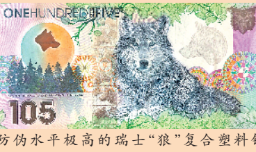
防伪水平极高的瑞士“狼”复合塑料钞

由这种特殊的聚丙烯薄膜做成的基材无纤维、无空隙、具有突出的抗拉抗强度、极好的耐用性。加上基材表面涂覆有特殊的保护涂层，防水、防潮、防污等性能也十分优异。有些塑料钞中还添加了动物油脂以抗静电。