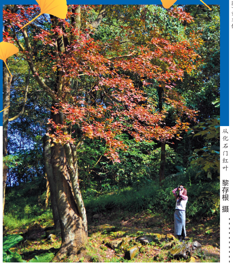
从化石门红叶

游玩理由: 这是最能体现广东乡村秋冬时令美景的一条线路组合。根据往年经验,当地银杏秋色持续时间通常为1个月左右,每年11月中旬到12月中旬是观赏韶关南雄银杏的最好季节。本周开始可以说拉开了南雄最美季节的序幕,不要错过这一年中最佳的赏秋。 游玩特色: 南雄是有名的“银杏之乡”,深秋季节,南雄帽子峰林场银杏金黄,层层尽染,被许多摄影发烧友誉为“南雄九寨沟”。而坪田镇新墟村与迳洞村的千年古银杏群,目前有百年以上树龄的古银杏树5000多株,树龄最长的达1680多年。每到秋天,满地金黄,令人神往,大批摄影爱好者前来赏秋、观景、摄影,蔚为壮观。 面积约3平方公里的珠玑古巷是全国三大寻根地之一,被誉为“中华文化驿站,天下广府根源”。 Tips: 每逢周末赏南雄银杏秋色,游客流量大,需尽早预订当地酒店民宿。如果当地住宿满员,可预订毗邻南雄的江西大余县城的酒店,相隔距离不远。赏秋色的景点道路容易堵车,最好天亮就出发前往。