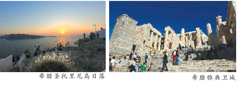
希腊圣托里尼岛日落 希腊雅典卫城

随着国与国间的友好关系进一步加深,希腊与巴西成为中国游客眼中的旅游热点目的地。这两个分别地处