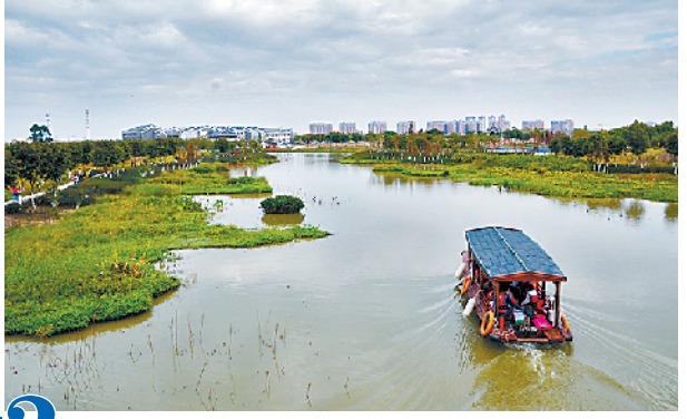
东莞华阳湖湿地公园

游玩理由: 东莞是珠三角著名水乡,麻涌镇更是水乡中的代表,围绕华阳湖国家湿地公园,开发了多种乡村旅游特色产品,让都市人更好地体验乡村生活。 游玩特色: 华阳湖国家湿地公园拥有水上绿道项目和绕湖骑行路线,其岭南水乡生态湿地成为珠三角水乡旅游新地标;月满楼的“全蕉宴”“河鲜宴”更是难得的水乡特色菜。附近的古梅生态农业园则是一个集主题度假、水乡休闲、园林观光、农业体验、乡村餐饮于一体的新概念生态旅游观光示范园区,可在创客坊享美食、赏美景,亦可在中大创客坊夜市一条街寻味