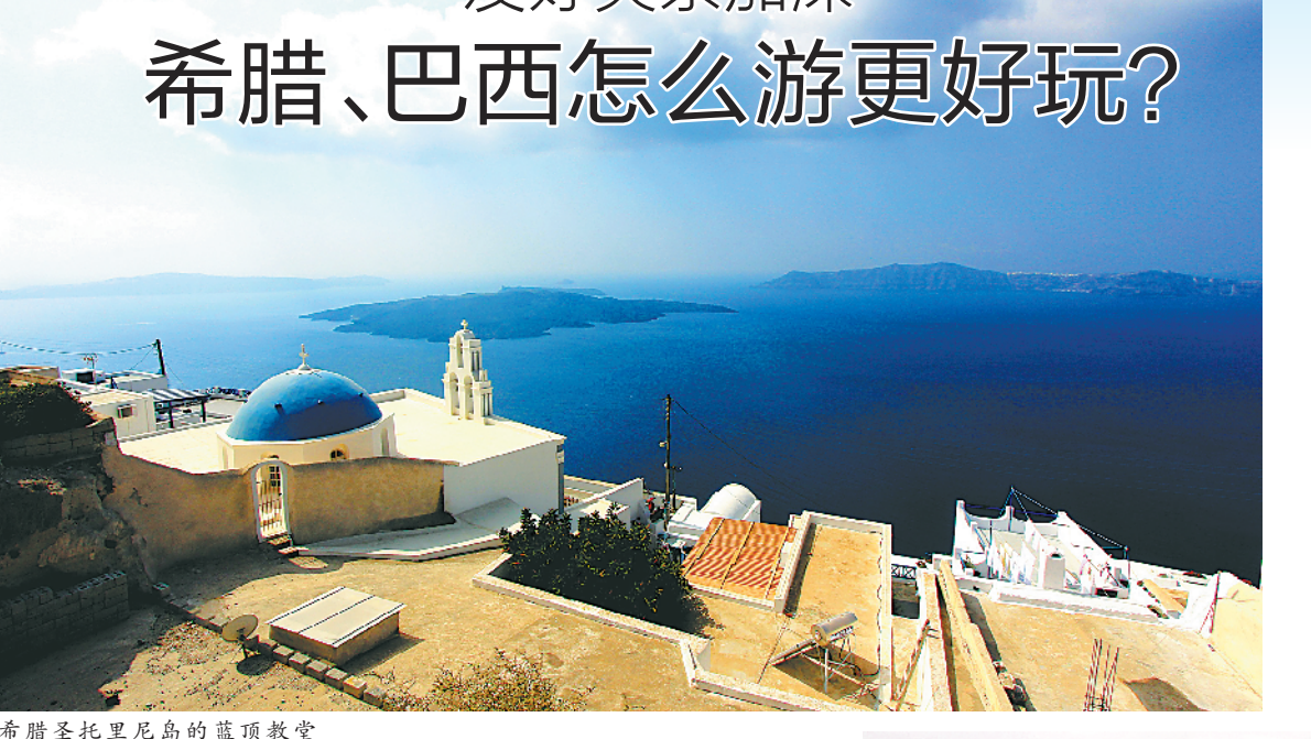
希腊圣托里尼岛的蓝顶教堂

爱琴海:跳岛浪漫之旅 爱琴海是希腊旅游的另一个代名词,它在很多人心中是浪漫的象征。要了解爱琴海,“跳岛”(在岛屿之间来往旅行)是最好的方式。 其中,圣托里尼岛是爱琴海中最为人所知。在这里,每个人都能感受到印象中的爱琴海:阳光、蓝天、碧海。岛上的伊亚(Oia)小镇,是一个号称拥有全世界最美日落的地方,有着全世界最著名的日落、漂亮的教堂、迷人的白色小屋。悬崖别墅酒店则是圣托里尼的另一个标志,站在1000英尺的山顶上,地中海的壮观景象尽收眼底。 除此之外,希腊还有许多特别的海岛。克里特岛是希腊第一大岛,也是诸多希腊神话的发源地。岛上种有橄榄、葡萄、柑桔等,鲜花遍地盛开,岛四周是万顷碧波,有“海上花园”之称。米洛斯岛是卢浮宫镇馆之宝之一“米洛斯的维纳斯”的发掘地,如今依然可见保存完好的剧场和古城遗址。 Tips: 最佳旅游时间:5月至9月是希腊旅游旺季,岛上酒店和机票都需要提前预订,岛上多数酒店都会提供港口和机场的接送。 交通: 可先到希腊首都雅典,从雅典乘飞机1小时可到达圣托里尼岛,圣托里尼机场每天有航班飞往米洛斯岛。乘轮渡从雅典到圣托里尼岛大约需9小时。 签证: 希腊是申根协定成员国,办理申根签证。