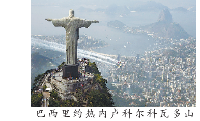
巴西里约热内卢科尔科瓦多山