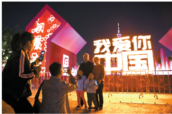
璀璨灯光照亮花城广场

人民解放纪念雕像区域通过特制的地砖灯将木棉花瓣与五角星拼接形成主题元素,灯光烘托园林树景,提升东园、西园整体亮度,丰富灯光层次,彰显广州城市夜景的独特魅力。