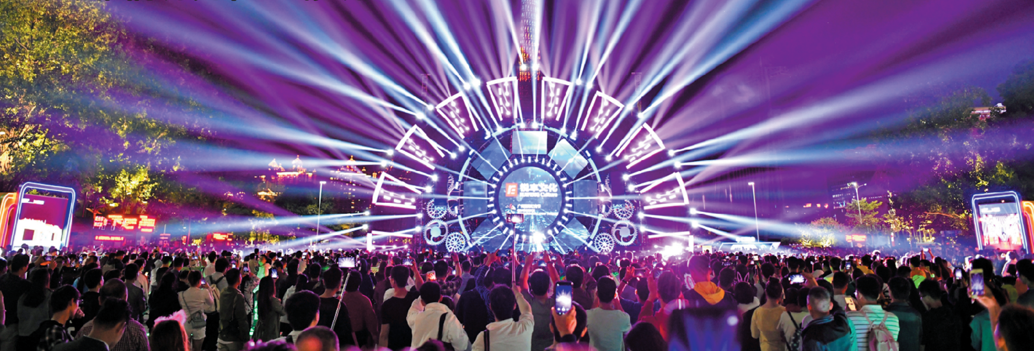
花城广场的灯光作品与广州塔交相辉映

羊城晚报讯 记者赵燕华、丁玲,通讯员穗建、田伟松、梁志报道:海心沙主会场,卡通版的关羽、张飞化身为一对萌萌的吉他男神,以声、光、影打开了本届充满国韵风味的广州国际灯光节的大门。18日20时,第九届广州国际灯光节正式亮灯。从广州新中轴线上的花城广场和海心沙,到白云山山顶公园,从南沙海滨到花都融创文旅城,从海珠广场到荔湾湖畔,10个会场华灯绽放,闪耀羊城。灯光节从18日至27日举行,每天18:00—22:00亮灯。