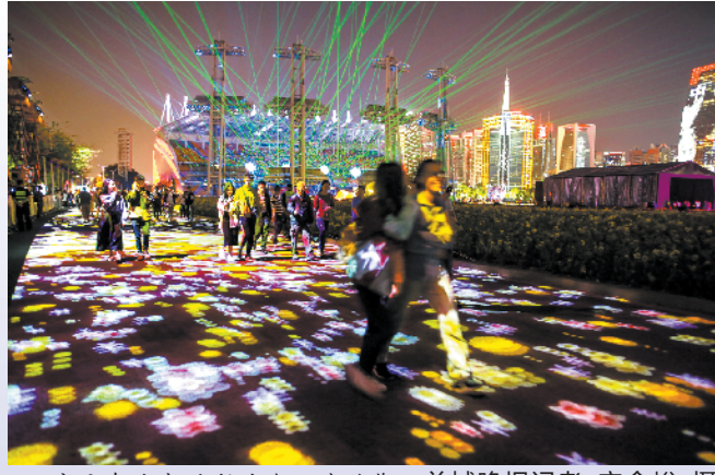
市民在流光溢彩的海心沙游览