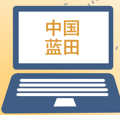
羊城晚报记者 戴曼曼

值得注意的是，英飞拓多次申明，引入战略投资者深投控非“救市”行为，上市公司和控股股东均无资金链问题，而是双赢的合作。