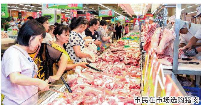
市民在市场选购猪肉

全省范围内,本月来,生猪价格冲高回落。记者从广东省农业农村厅了解到,9日-15日,全省生猪平均收购价格为40.35元/公斤,较前一周下降8.23%;白条肉平均出厂价格为