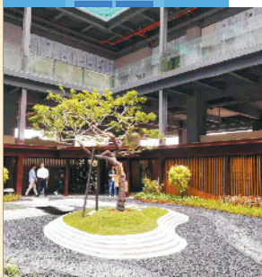
为了抢客,不少楼盘赶制出临时样板房