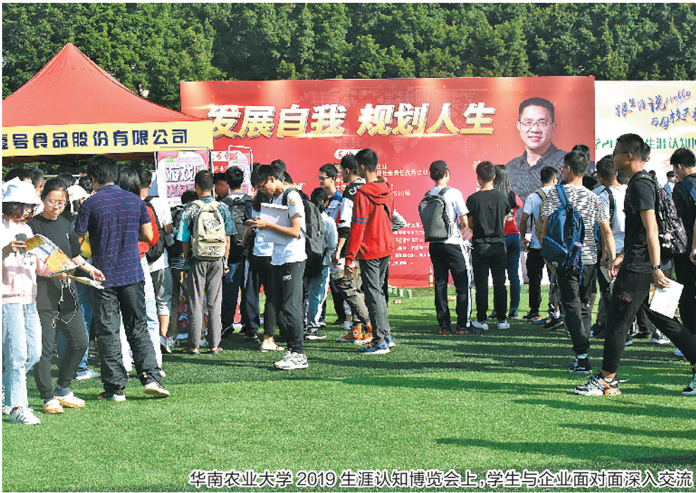
华南农业大学2019生涯认知博览会上,学生与企业面对面深入交流

她特别提醒,同一专业在不同学校,对首选和再选科目的要求可能也有不同,需要特别留意。比如中山大学历史学,首选科目要求为物理或历史,再选科目不提科目要求;暨南大学历史学则要求,首选科目仅历史,再选科目地理必选。