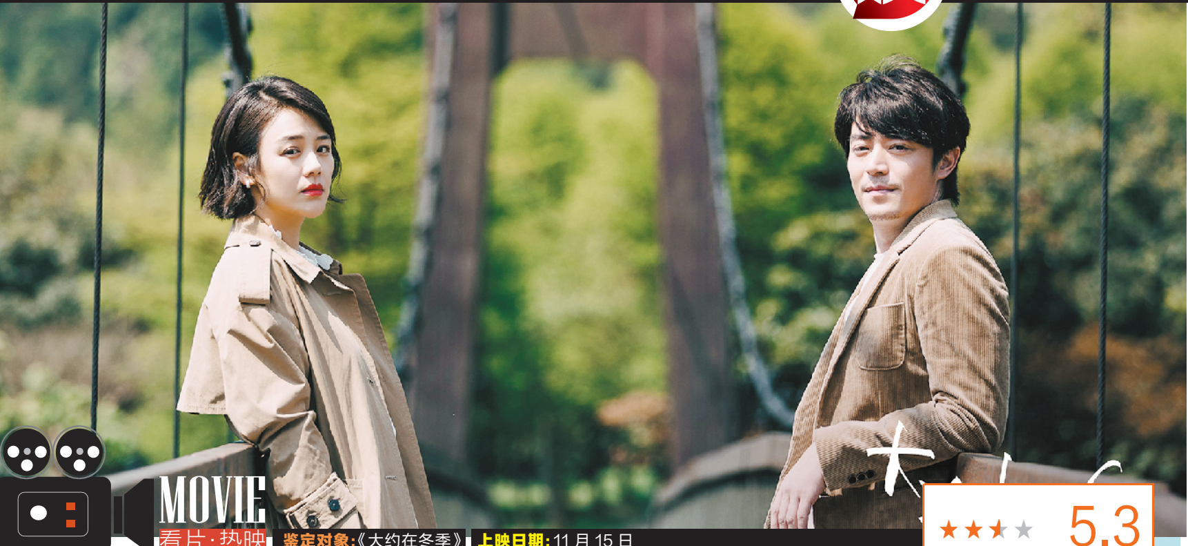
文/一大波 鉴定对象:《大约在冬季》 上映日期:11月15日