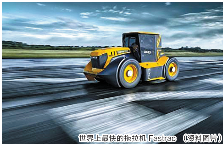
世界上最快的拖拉机Fastrac（资料图片）

JCB集团表示，Fastrac系列大马力拖拉机一直受欧美客户的一致赞誉。它不仅在田间作业，通过加装特殊的推雪铲，它还能完成迅速清理积雪路面等工