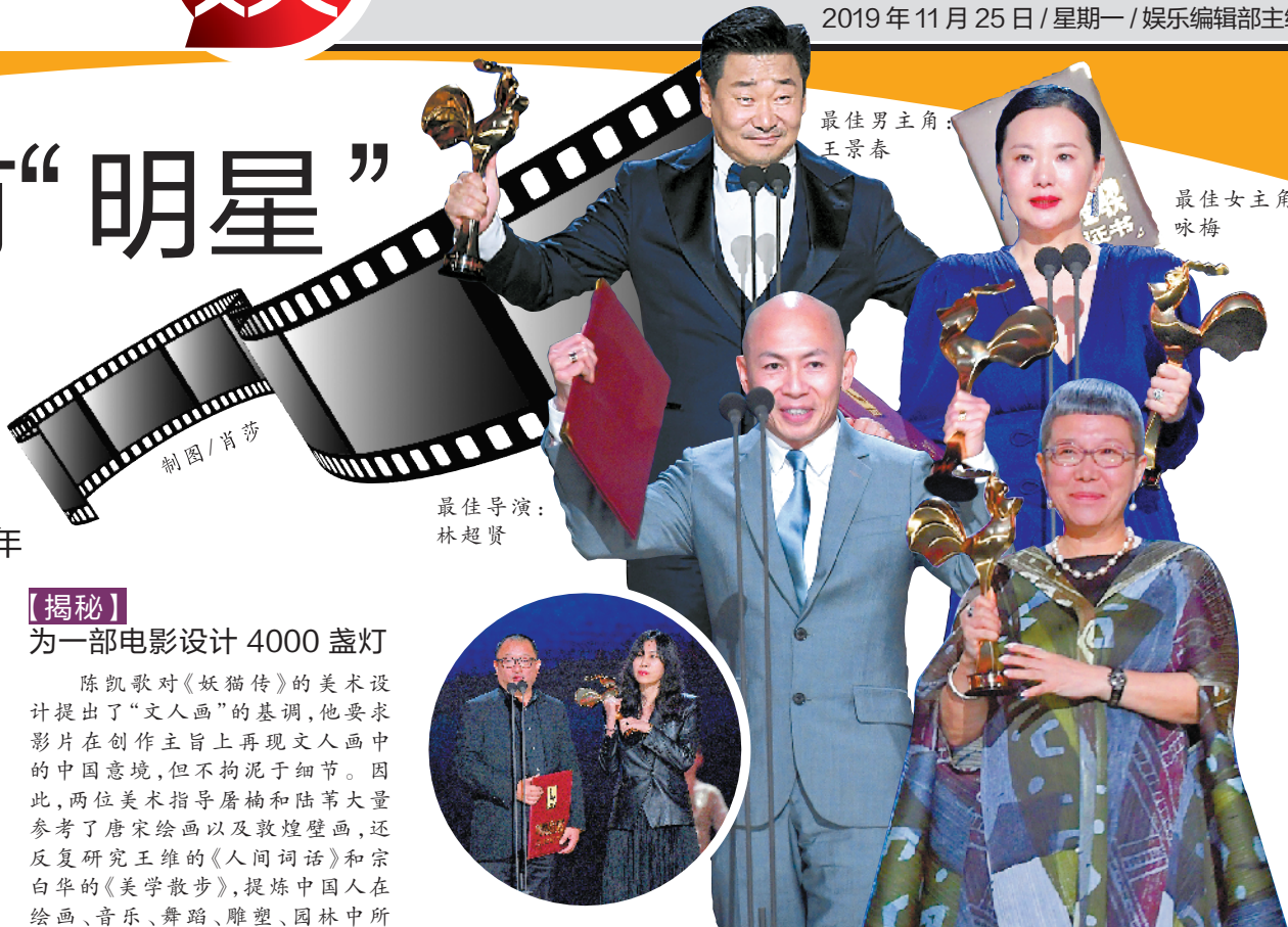
最佳男主角：王景春；最佳女主角：咏梅；最佳导演：林超贤；最佳编剧奖：王小帅、阿美；最佳中小成本故事片《红花绿叶》导演：刘苗苗

林超贤说，他一直在找机会感谢“师父”陈嘉上。林超贤并非科班出身，因为喜欢枪械也喜欢电影，被陈嘉上发现后带入电影圈。他从副导演做起，多年后终于在1997年拍摄了导演处女作《G4特工》，陈嘉上专门为他找来了包括《英雄本色》摄影师黄永伦在内的金牌班底。1998年，陈嘉上又与林超贤联合执导《野兽刑警》，该片在香港电影金像奖中获得最佳导演奖。林超贤在电影圈的地位，特别是他近年来的作品《破风》《湄公河行动》《红海行动》均叫好又叫座。