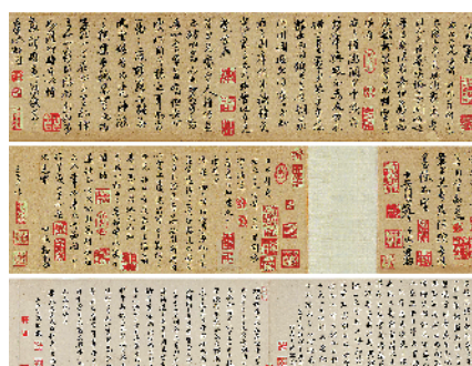
《致郭佑之二帖卷》

先说说这件作品的作者赵孟頫。赵孟頫几乎是除王羲之、王献之外,中国人都知道的大书法家。有谓欧颜柳赵,学过书法的人都知道欧颜柳赵指的是欧阳询、颜真卿、柳公权、赵孟頫这四位中国书法史上的楷书大家。欧颜柳赵书法的风格迥异,各领风骚。今年年初,日本举办颜真卿书法大展,颜真卿更为名声远播,风头一时无两!