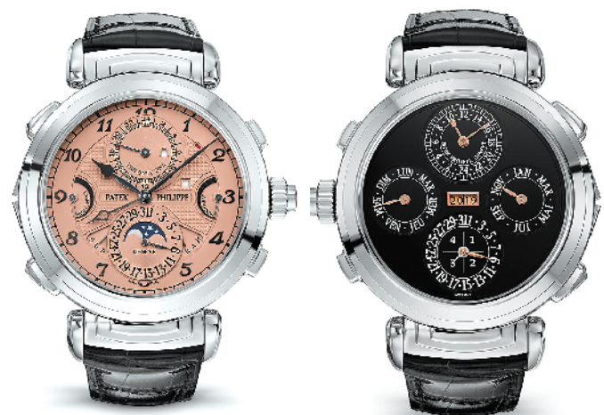
▲2.5亿元的“史上最贵腕表”百达翡丽6300A(正反两面可拼接)

羊城晚报:今年GPHG有什么突出特点,给你留下最深印象?对腕表收藏风向是否有影响?