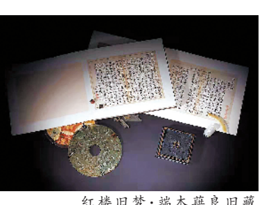
红楼旧梦·端木蕻良旧藏