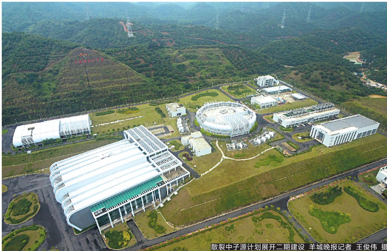
散裂中子源计划展开二期建设