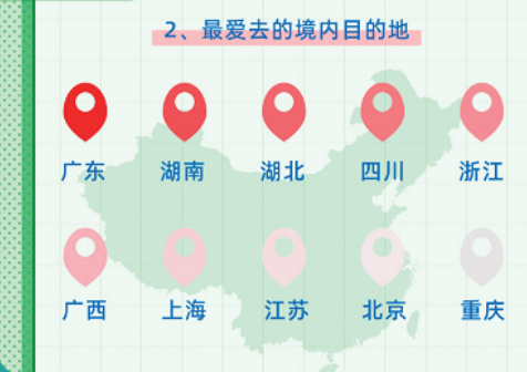
《爸妈本地生活图鉴》制图/唐欣怡