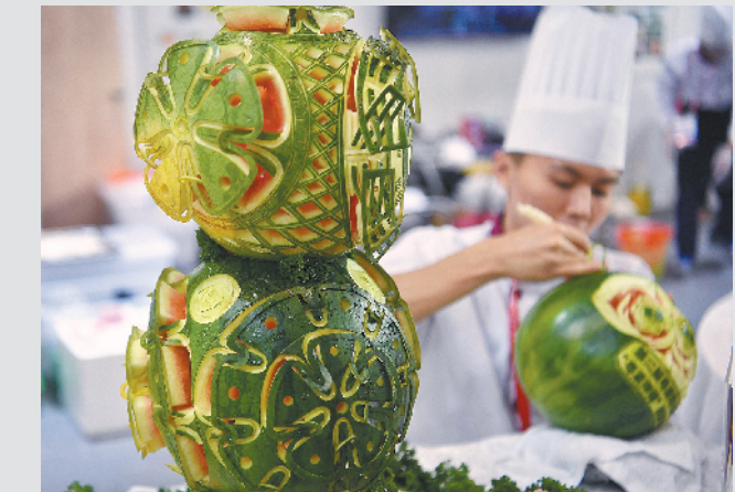
开幕式现场，粤菜制作展示吸引眼球