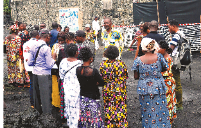
11月14日，刚果(金)的居民聚集在医护人员周围听其介绍由强生公司生产的第二种埃博拉疫苗

刚果(金)地方政府和医疗部门28日说，刚果(金)东部两个埃博拉疫情应对中心当天凌晨遭遇夜袭，多人死伤，其中包括世界卫生组织工作人员。