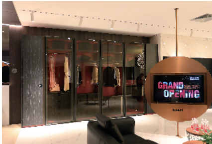
■ 科勒衣柜柯瑞系列

衣帽间而生。整体壁挂式无柜体结构，线条平直流畅，勾勒出大气的全开放式空间。所有组件可自由调整、灵活搭配，贴合现代都市对品质和高效的诉求。智能感应灯和下拉挂衣杆的贴心设计，是设计师的暖心之意。加上科勒定制皮革配件，细节之处彰显不凡与华贵的品味。