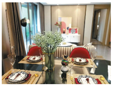
金科博翠明珠的住宅设计中规中矩

造价约2000万元的会所是销售人口口中的卖点，坐在会所内感觉不错，只不过，每个人对会所的看重程度可能不一样。