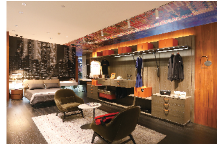
■ 科勒衣柜卡斯托系列