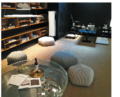
明珠天悦江湾赠送的地下室主要靠人工照明

135-160平方米的叠墅是该楼盘赠送面积最大的产品，虽然房产证部分面积有上下两层，但每套叠墅都送两层地下室，此外还有花园赠送，赠送面积据说有200平方米左右。不足之处是非首层的单位与赠送的地下室之间只能通过电梯交通，之间没有直接的楼梯相连，万一电梯失灵，去地下室还要绕道公共空间，非常麻烦。另外，地下室几乎没有天然采光和通风，所有赠送面积也可能不写进房产证。