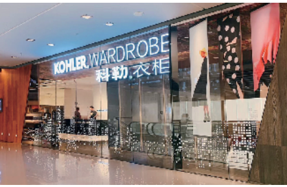
■ 科勒衣柜番禺展厅

科勒衣柜以优化和提高用户体验为核心，特别提出了“男女分区”衣柜的概念。从“有条理的收纳”及“分季储藏”角度切入，在功能化和人性化方面精益求精，让衣柜的使用体验达到一个全新的高度。此外，兼有丰富的材质与色彩选择，也让外观匹配于更多家装风格。