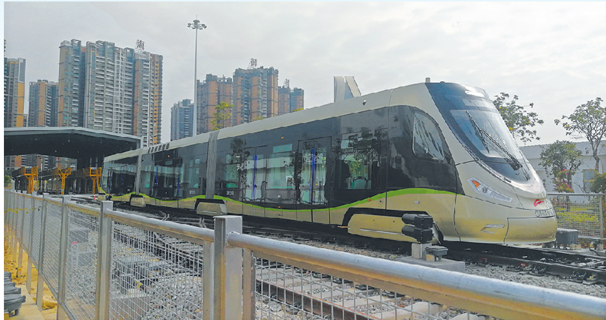
昨日上午,氢能源有轨电车在佛山市高明区开出

同时,以“新机场、新能源、氢城而出”为主题的2019年佛山氢能源产业交流峰会在高明举行,《佛山市高明区氢能产业发展规划(2019-2030年)》正式发布,力争到2030年将高明区建成“中国氢城”。