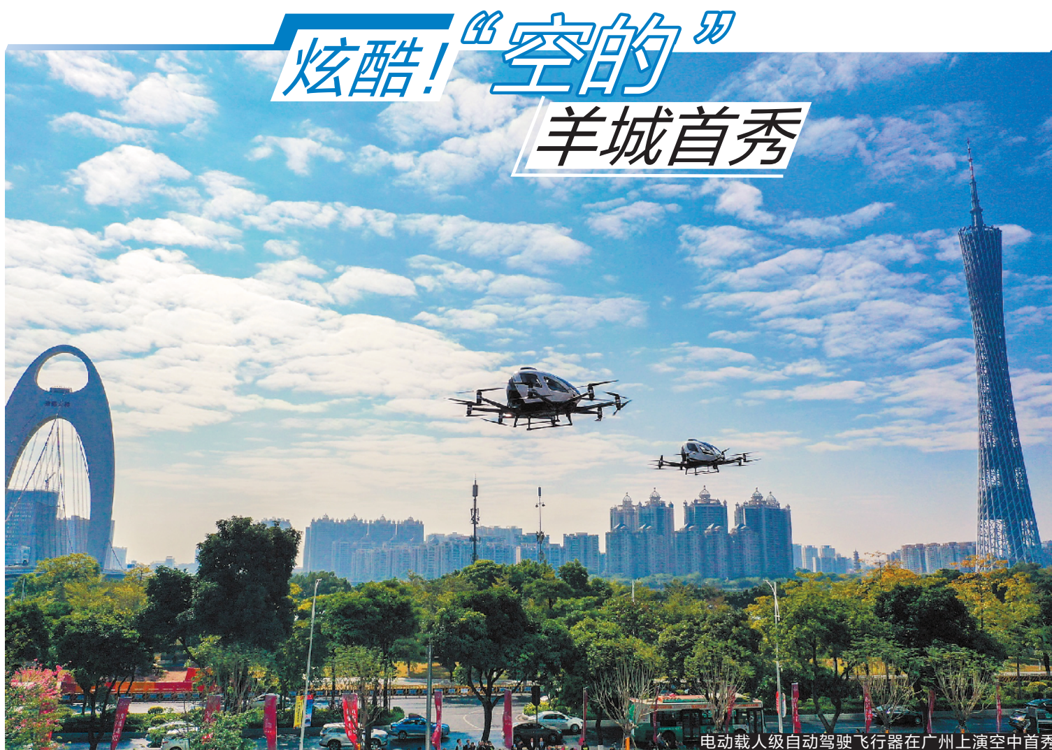
电动载人级自动驾驶飞行器在广州上演空中首秀

羊城晚报讯 记者罗仕、通讯员冀晨悦摄影报道：11月30日，6架电动载人级自动驾驶飞行器在广州上演“空的”首秀。当日，全球领先的自动驾驶飞行器科技企业亿航智能与广州