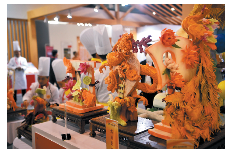
粤菜展品精美如画

据介绍，如今“粤菜师傅”工程将粤菜师傅培养与粤菜美食、乡村旅游、民俗文化等相结合。依托粤港澳大湾区、借助“一带一路”走出国门，打造弘扬岭南饮食文化的国际名片。