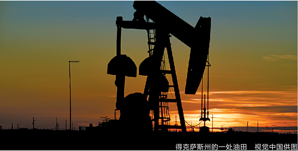
得克萨斯州的一处油田