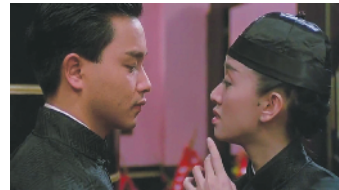
为电影《胭脂扣》谱写的同名主题曲亦成经典

黎小田1982年在TVB举办了第一届新秀歌唱大赛,当时还在酒吧唱歌的梅艳芳在黎小田的鼓励之下报名参赛,最终以第一名出道。比赛之后,黎小田评价梅艳芳道:“从新人来讲,再来十年,都不会出一个像她这样好的。”1989年,黎小田为电影《胭脂扣》写了同名主题曲并交由梅艳芳演唱,这首歌也帮助他获得了第8届香港电影金像奖最佳电影配乐。