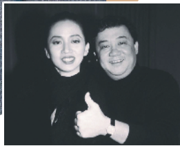
黎小田是张国荣(上)、梅艳芳(下)的伯乐