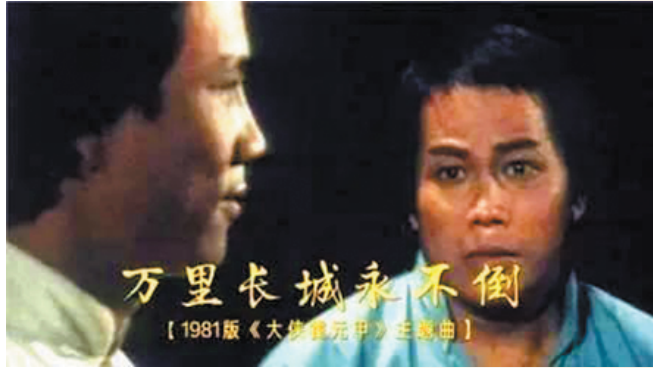
为《大侠霍元甲》创作的主题曲《万里长城永不倒》脍炙人口