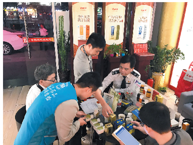
执法人员突击检查

羊城晚报讯 记者郭起摄影报道:“不要全信医生的检查,应该把钱花在保健品上。”有媒体记者卧底中科创新牌灵芝孢子油软胶囊的“专家讲座”,发现这款售价2600元一瓶的保健品被宣传成“能治疗肿瘤又能保健”,“中科”被解释成“中国科学院”。