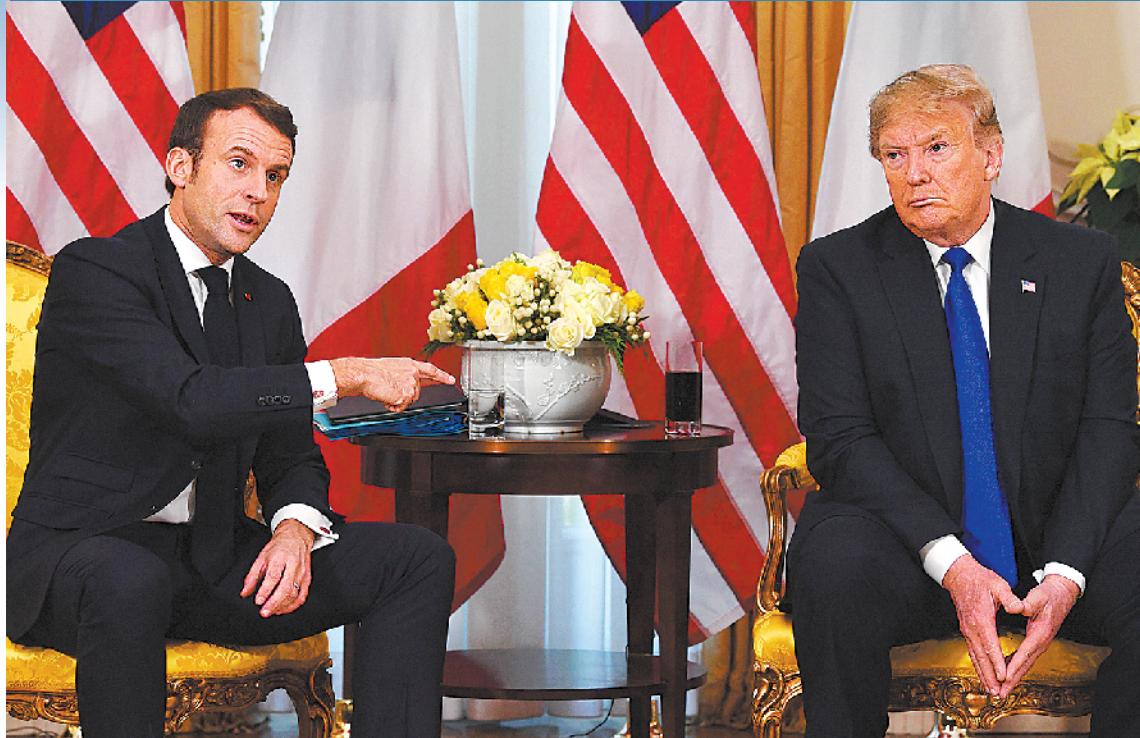
北约峰会期间，马克龙和特朗普举行了会谈

北大西洋公约组织成立70周年峰会在英国首都伦敦举行。成员国各有算盘，峰会伊始矛盾凸显。土耳其试图以一项北约军事防御计划为筹码要求盟友为其“站台”。美国3日抨击法国所提北约经历“脑死亡”言论。