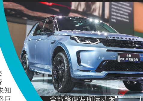
全新路虎发现运动版